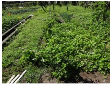
倒伏しちゃってます。

9月には台風が高知に来て農園にも少なからず影響が出ました。一番の影響はコーヤでした。