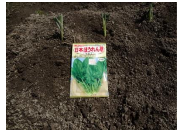
一緒にネギを植えると、虫が来ないとか。来ますけどね。

そして少しずつ秋まきの野菜を植えています。ホウレン草、小松菜、タマネギやフロロッコリーなど植えて行こうと考えております。お力添え頂ければ幸いです。