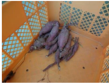
そこそこには成っています。