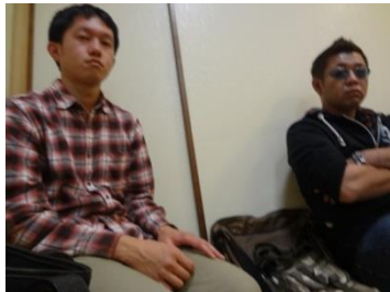
気を抜いた二人の顔