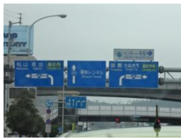
香川に向かう 車中にて

今月二日にとろの若者五人で香川に行き、若者たちの交流会「ひきこもりの休日」に行ってみたりした。高知からは親も含めるとかなりの大所帯となったので、車数台に分かれて香川に向かいました。